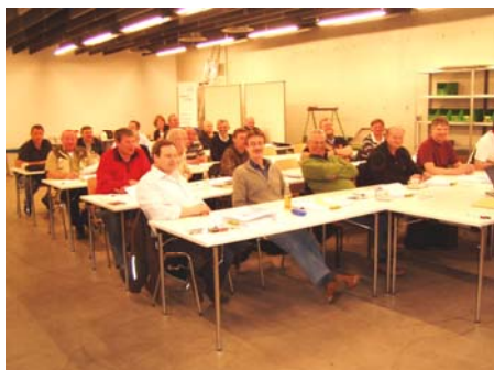
Teilnehmer am Erfahrungsaustausch

(se) Der traditionell in der K-Woche stattfindende Erfahrungsaustausch war diesmal sehr gut besucht und hat - dem Vernehmen nach - allen Teilnehmern neues Wissen vermittelt und viel Spaß gebracht..